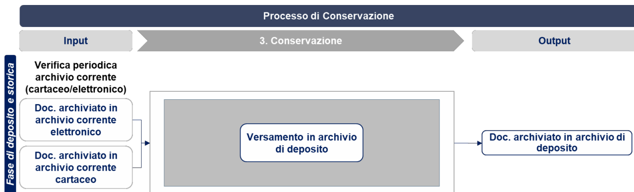
Figura 5 - Processo di conservazione

Manuale di gestione del protocollo informatico, dei flussi documentali e degli archivi