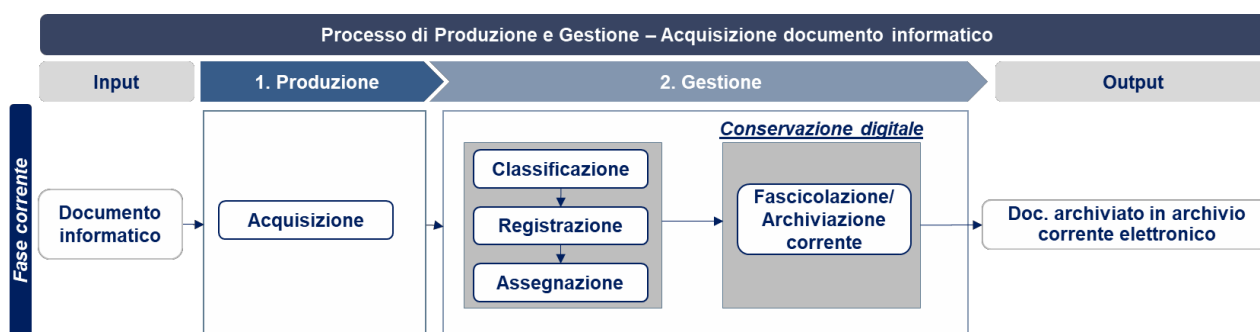
Figura 3 - Acquisizione del documento informatico

Di seguito si fornisce la rappresentazione grafica del processo sopra descritto.