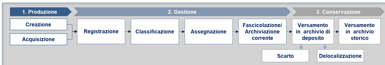
Figura 1- Ciclo di vita del documento

Il ciclo di vita del documento è articolato nei processi di produzione, gestione e conservazione: